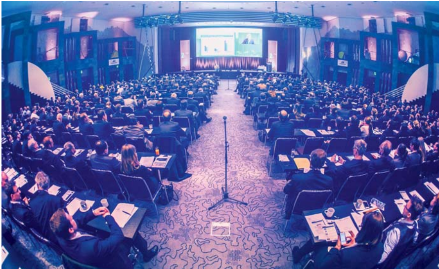
Die Deutsche Aktuarvereinigung begrüßt jedes Jahr mehr als 1.000 Mitglieder zu ihrer Jahrestagung und Mitgliederversammlung.